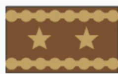
generálmajor major general