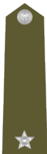
podpraporčík warrant officer