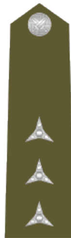
nadrotmistr master sergeant