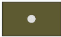
svobodník private first class