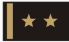
podplukovník lieutenant colonel