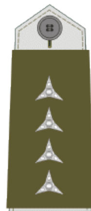
štábní rotmistr first sergeant