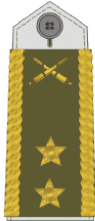
generálmajor major general