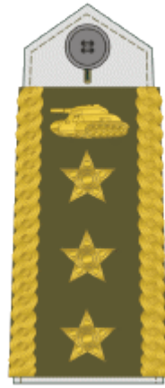
generálporučík lieutenant general