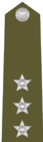
nadpraporčík chief warrant officer i