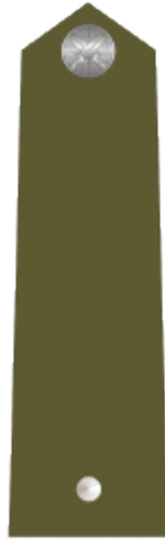
svobodník private first class