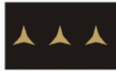
nadporučík first lieutenant