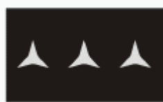
nadrotmistr master sergeant