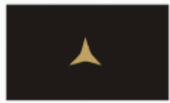
podporučík second lieutenant