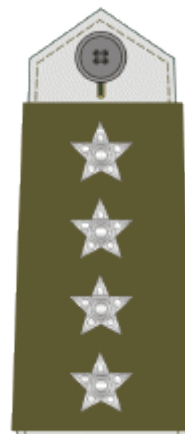
štabní praporčík master warrant officer