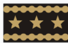
generálporučík lieutenant general