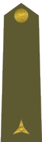
podporučík second lieutenant