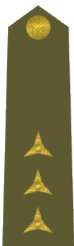
nadporučík first lieutenant