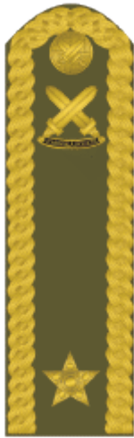
brigádní generál brigadier general