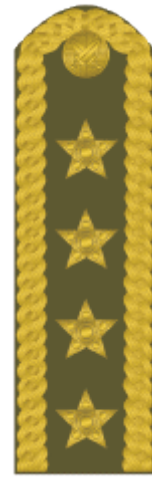
armádní generál army general