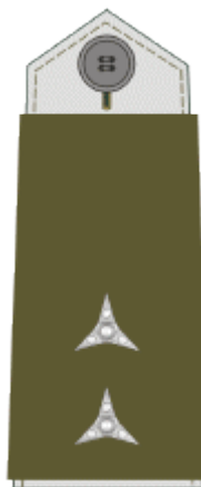
rotmistr sergeant first class