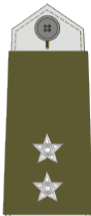
praporčík chief warrant officer ii