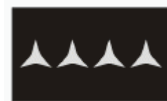
štábní rotmistr first sergeant