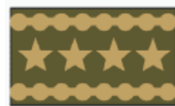
armádní generál army general

hodnostní označení na stejnokrojích vz. 95 je se zeleným potiskem. na stejnokrojích vz. 95 letních s béžovým potiskem je hodnostní nálepka v barvě hnědé rank insignia worn on uniform m95 with green print. summer uniform m95 with brown print a stick-on rank insignia label in brown colour