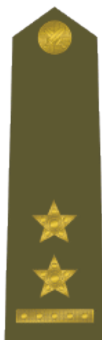
podplukovník lieutenant colonel