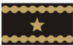
brigádní generál brigadier general